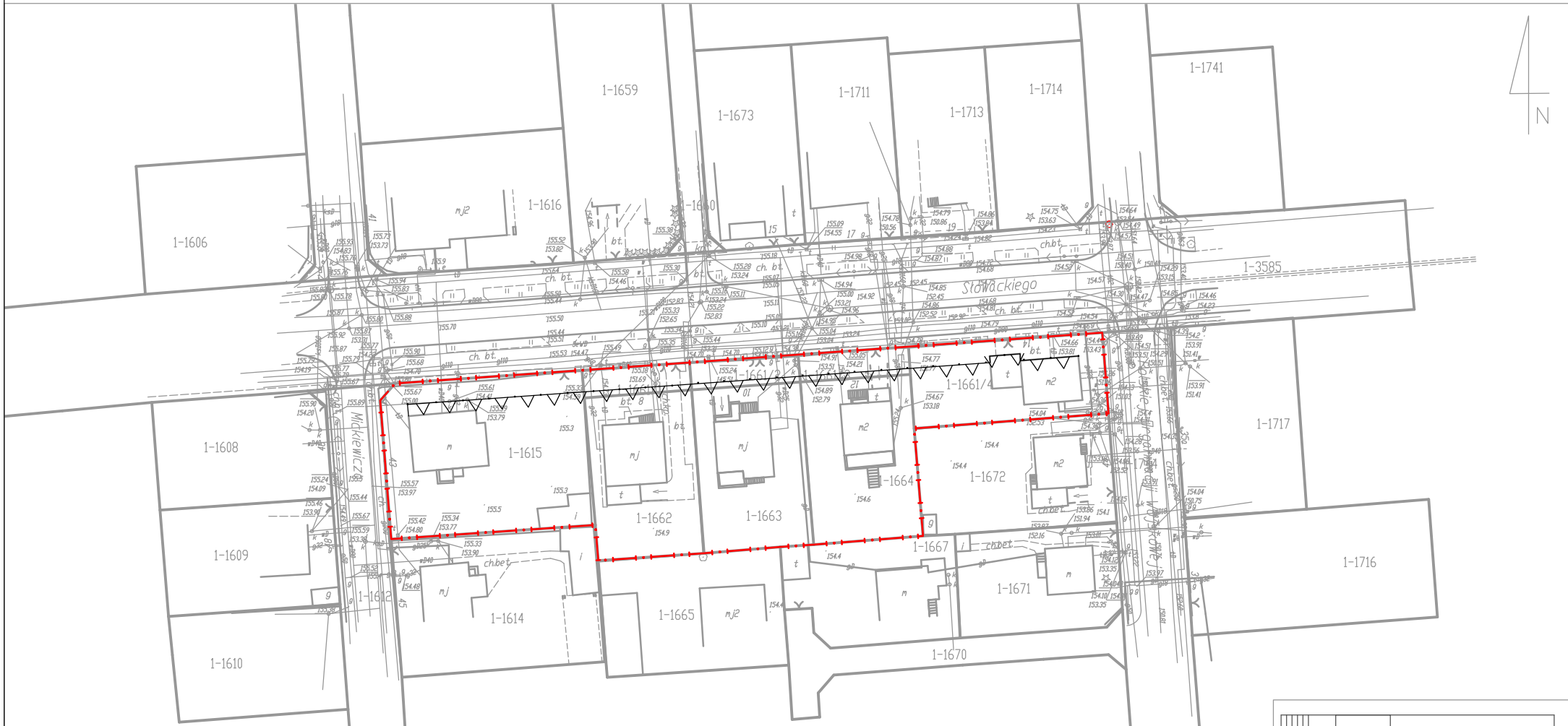
Studium uwarunkowań i kierunków zagospodarowania przestrzennego gminy Grójec Uchwała nr XXX/229/12 Rady Miejskiej w Grójcu z dnia 10 września 2012r.

Załącznik nr 1 do Uchwały nr Rady Miejskiej w Grójcu z dnia 2019 roku