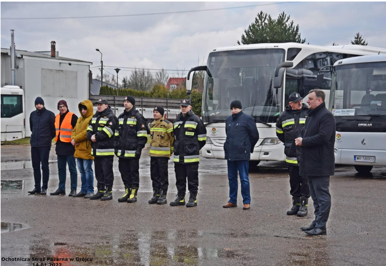
Ochotnicza Straż Pożarna w Grójcu 14.01.2022