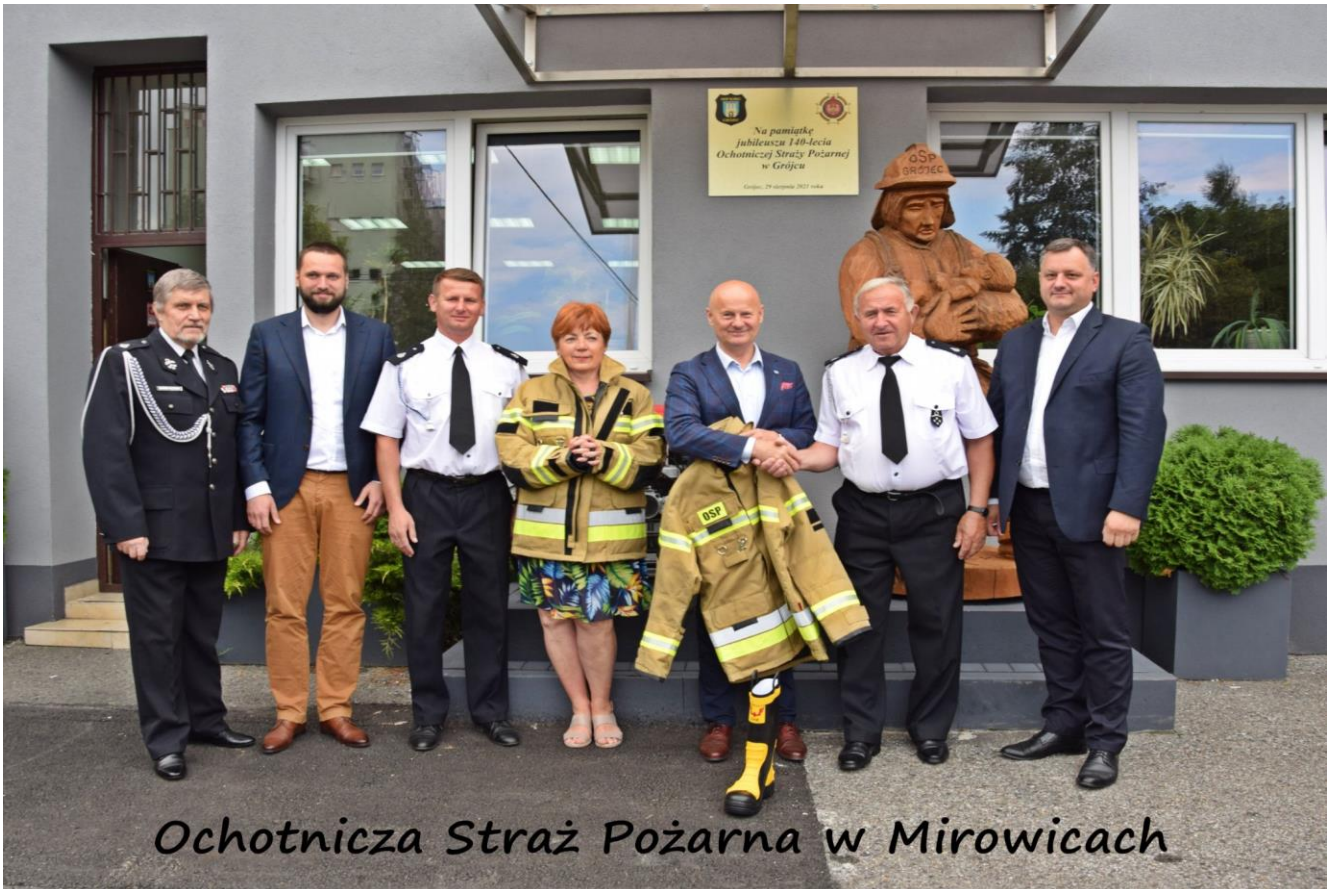
Ochotnicza Straż Pożarna w Mirowicach