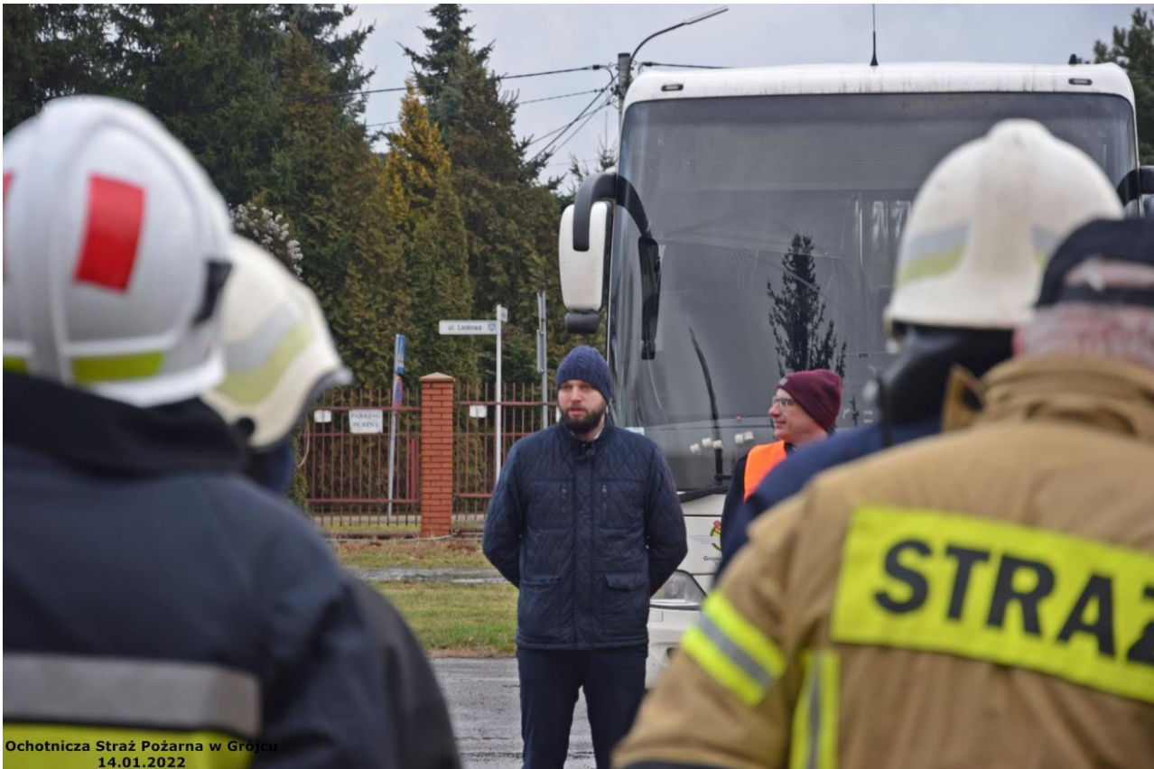
Ochotnicza Straż Pożarna w Grójcu 14.01.2022