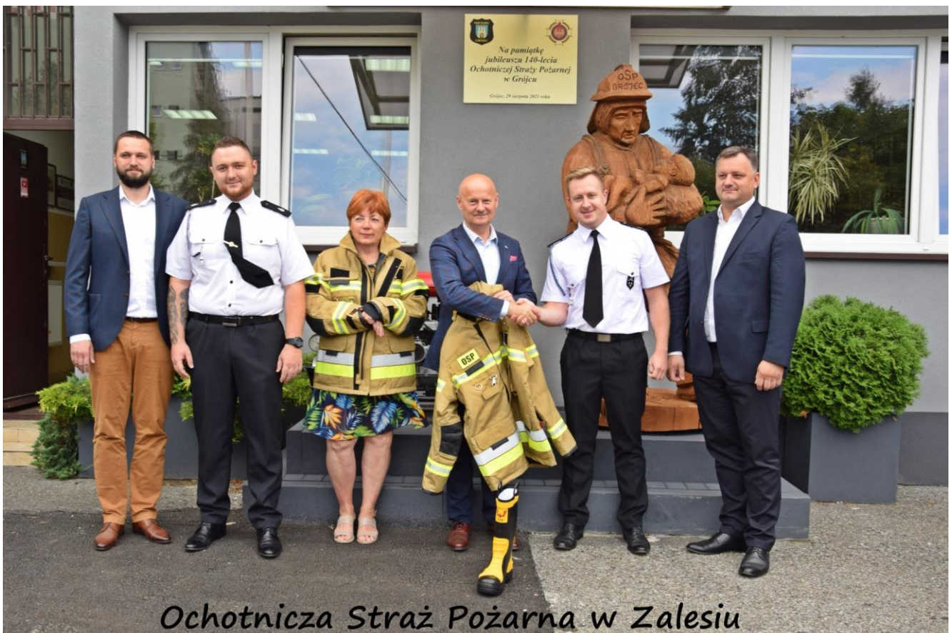
Ochotnicza Straż Pożarna w Zalesiu