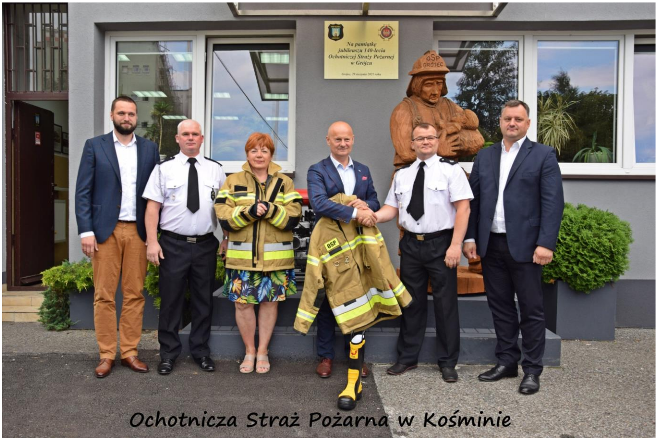
Ochotnicza Straż Pożarna w Kośminie