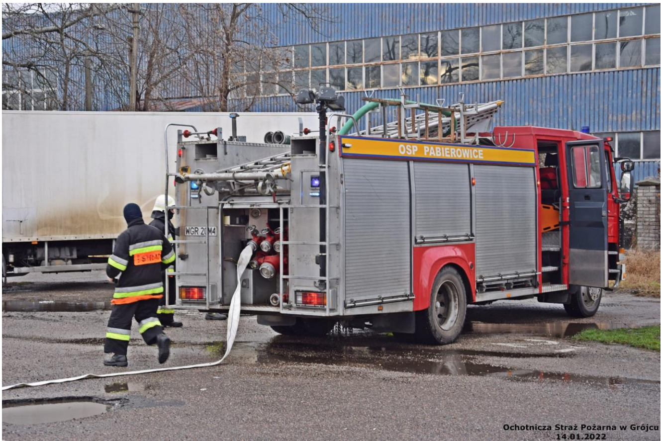
Ochotnicza Straż Pożarna w Grójcu 14.01.2022