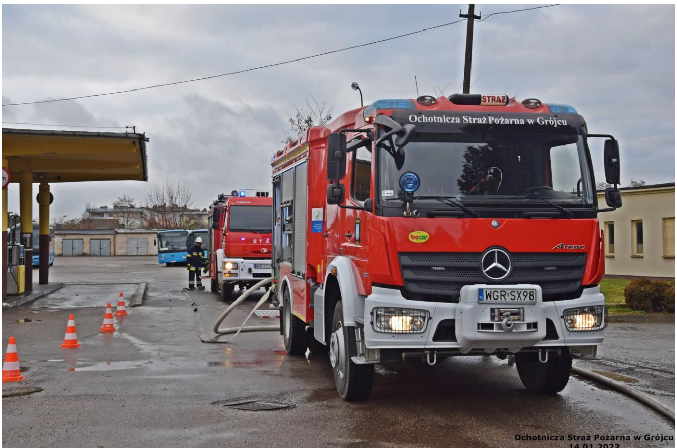
Ochotnicza Straż Pożarna w Grójcu 14.01.2022