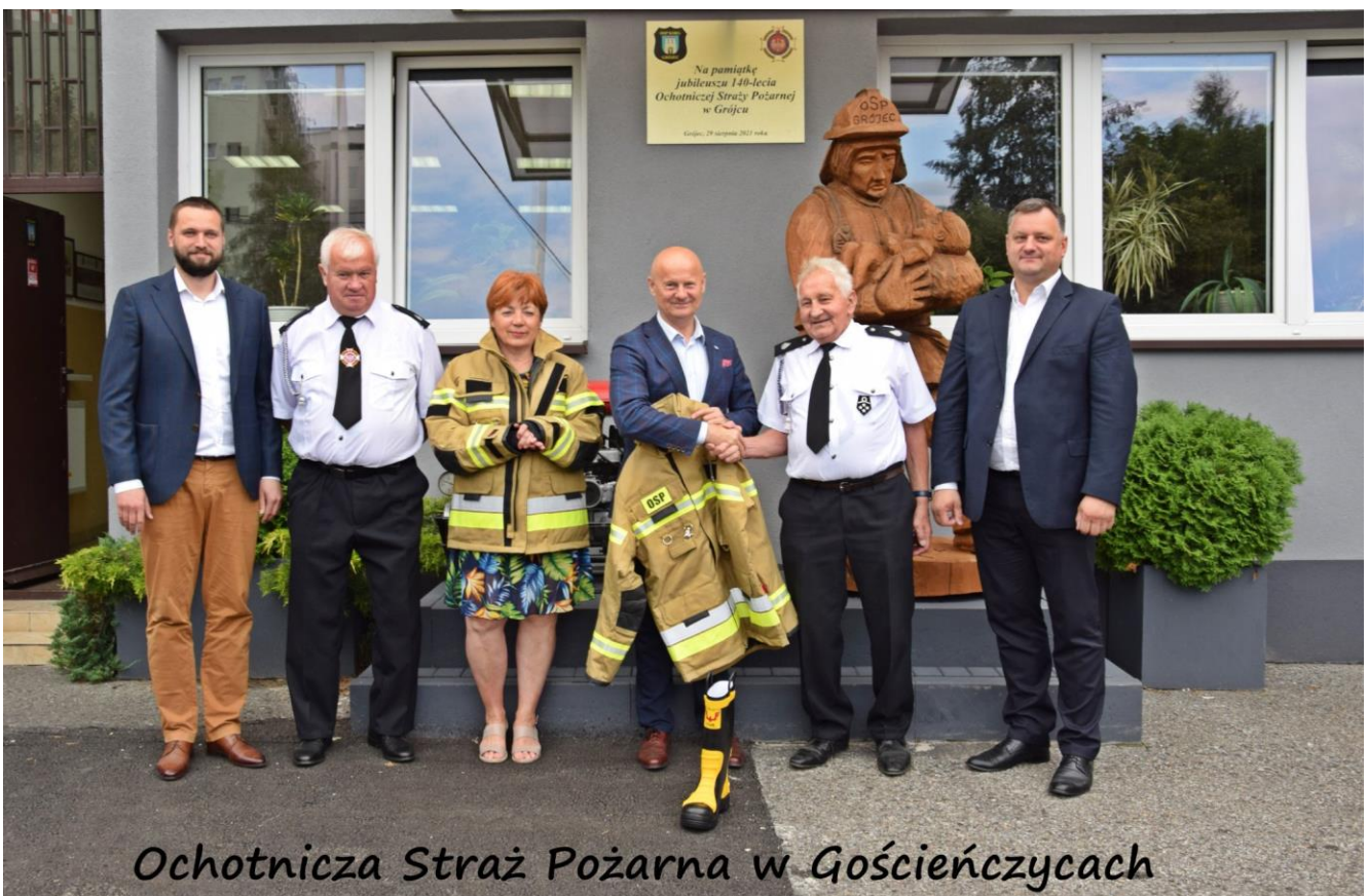
Ochotnicza Straż Pożarna w Gościeńczechach